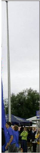
wurden die... anschaffen... hymne des