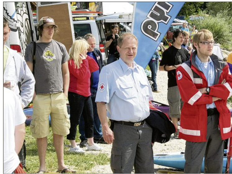
Den Rettungsdienst übernahm die BRK-Bereitschaft mit Kollegen aus...