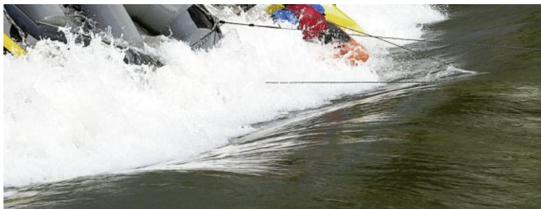
e in der Isarwelle und die Besatzung ging dabei über Bord.