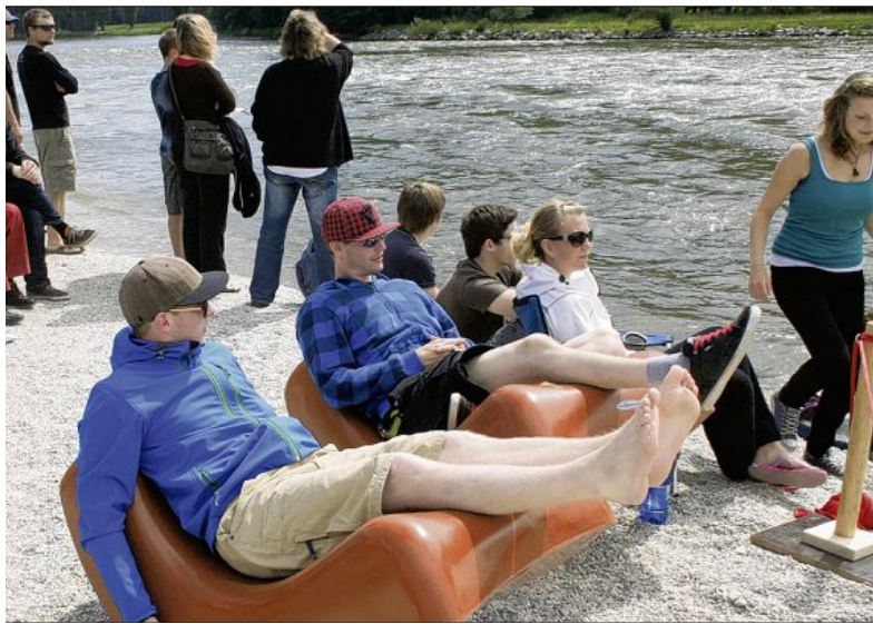
auer verfolgten das Geschehen auf dem Wasser von Liegestühlen aus.