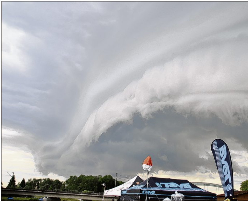
Diese „Welle“ bildete den Anfang des Unwetters.