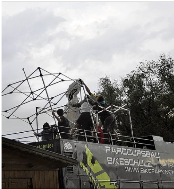
Die Pavillons am Pressewagen wurden komplett

Plattling. (lie) Die Unwetter, die am Mittwoch über Bayern zogen, machten auch vor Plattling und der Isarwelle nicht Halt. Doch obwohl die Viertelfinal-Läufe der Kajak-Weltmeisterschaft damit unter keinem guten „Wetterstern“ standen, zog man diese konsequent durch. Bis Mitternacht mit nur kurzen Unterbrechungen paddelten die Teilnehmer auf einer schäumenden Isar um die begehrten vorderen Plätze. Auf dem WM-Gelände an der Isar ging es allerdings auch auf dem