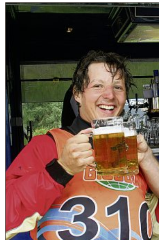
...und nachher gönnte er sich...